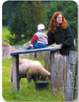
Zahlreiche Veranstaltungen: Archivgut ist Kulturgut

im Juli unter dem Motto „Von Knochenrüttlern und Drahteseln“. Alles drehte sich ums Fahrrad – vom klassischen Rad bis zum aufgemotzten Bike der Hamburger Fahrrad-tuning-Experten von ElbCoast Psycles. Der Kräutermarkt, der Kürbis- und der Apfeltag luden zwischen Juni und Oktober ein, die Vielfalt regionaler Produkte zu erleben. Der Ökologiehof setzt seinen Schwerpunkt im Bereich Ernährung und Landwirtschaft. Das in integrativer Behindertenarbeit angebaute Bioland-Gemüse wurde auch 2005 erfolgreich über eine Abo-Kiste und im Direktverkauf vertrieben.