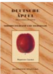
Neuauflage der „Apfelbibel“ aufgelegt