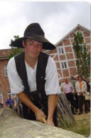
Haus des Handwerks eröffnet

Die Sicherungsmaßnahmen im Brandschutz wurden 2005 überholt: die Brandmeldeanlage im Ausstellungsgebäude und die Brandmelder in den historischen Gebäuden wurden komplett erneuert. Zusätzlich wurden Rettungswegpläne ausgehängt und die Feuerwehrpläne